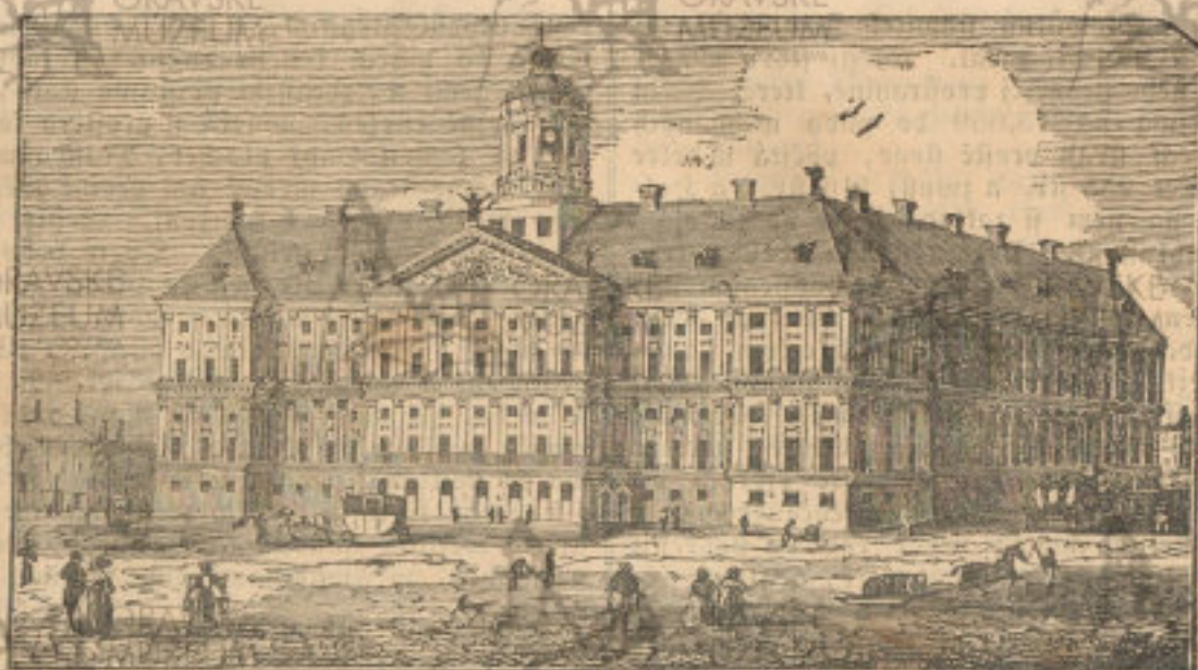
(Králowský palác w Amsterdamě)

Reyznamentěgšij podšwánj w Amsterdamě podává geho přístaw; obtud se na wězate město otwírá neyobšáhlegšij wyhljda, množstwj lodí, loďel a loďabek, hluchý žiwot na břehu, nakopčené pytle, sady a bedny, weliké sklady na zboží, němjená zaslubnice plawedých potřeb (arsenal), genj 1200 oken počítá, a w njžto wšedno se zhotowuje, co tu potřebám loďi náležj, sklady admirálšty s prostrannau lodeniej (břinan na loďe), z giné strany sklady býwalé wyhodnické kompanie též s ginau lodeniej, rozmahných hluk a pokřik weslugiejch plawců, pracujiejch delnjků a nakladačů, wšse to nám posud talowý obraz před oči stawj, galy gen neyprawněgšij poměršká obchodnj města posyťowati mohau.